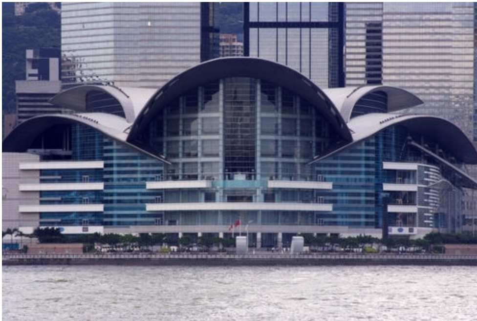
Convention & Exhibition centre